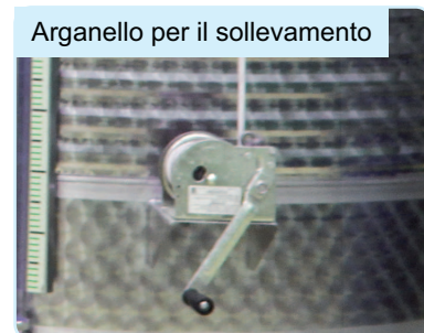
Arganello per il sollevamento