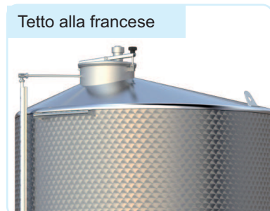
Tetto alla francese